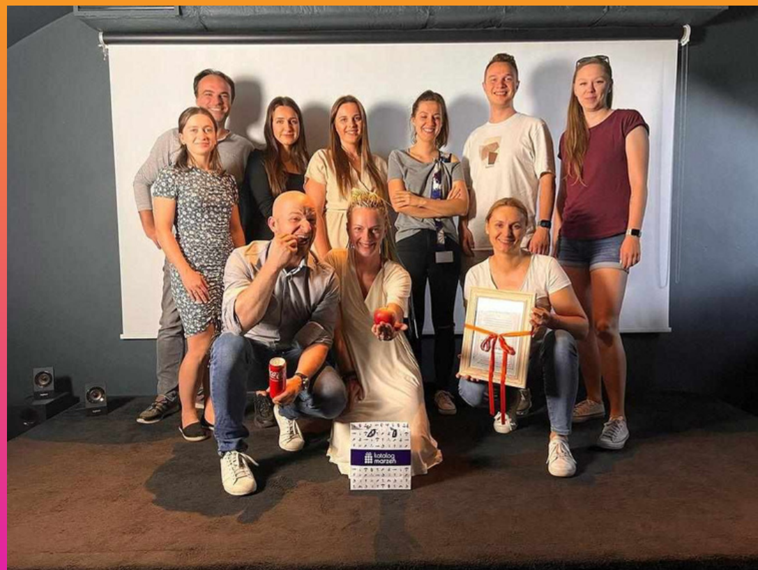
WARSZAWA - PRAGA